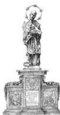
DIVUS JOANNES NEPOMUCENUS

O tom, zda budou tentokrát podpořeny všechny přihlášené projekty, rozhodne nejen Výběrová komise MAS dle jasně stanovených kritérií, ale rozhodnutí bude muset následně zpečetit i Programový výbor a Valná hromada. Konečný verdikt tak bude znám nejdříve ve 2. polovině června, kdy vybrané projekty budou registrovány na RO SZIF v Českých Budějovicích.