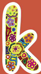
Vydáno 2009, NEPRODEJNÉ.

Grafická úprava: Gabriela Vorlová, tisk Agentura 68, www.68.cz náklad 1500 ks